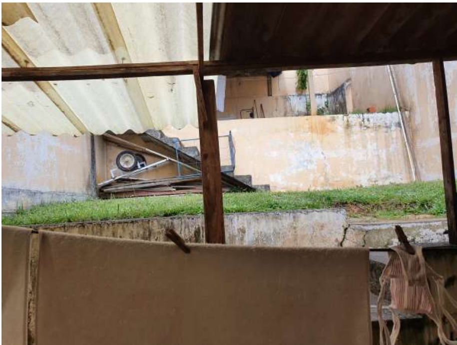
Ao fundo, edícula construída e não averbada.