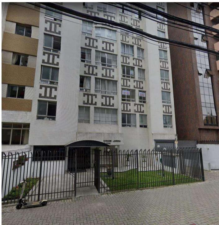
FACHADA DO IMÓVEL

3. BEM A SER AVALIADO: Apartamento nº 202, tipo "1", no 4º pavimento ou 2º andar, do Edifício Cidade Jardim, localizado à Rua Brigadeiro Franco, 2454, Rebouças, nesta capital, com a área construída de uso exclusivo de 42,24m 2 , área de uso comum de 11,08m 2 , área de estacionamento coletivo de uso comum de 16,88m 2 , com direito de estacionar um veículo de passeio de pequeno porte, no estacionamento localizado no 1º pavimento ou subsolo e 2º pavimento ou andar térreo, perfazendo a área correspondente ou global de 70,20m 2 , com demais confrontações, medições e características na Matrícula 20.623 do 5º Registro de Imóveis de Curitiba/PR.