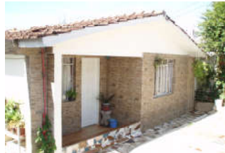
Frente da casa