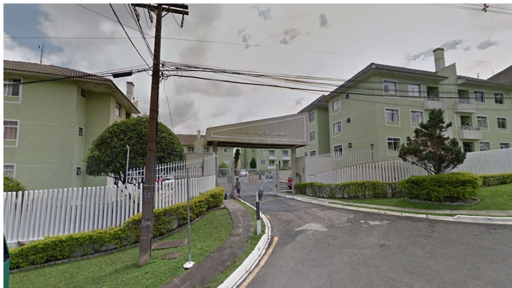
Imagem da fachada do condomínio do imóvel avaliando.