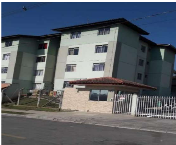
Imagem da fachada do condomínio do imóvel avaliando.