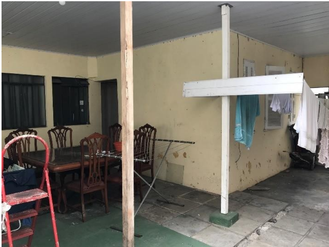
ÁREA EXTERNA CASAS