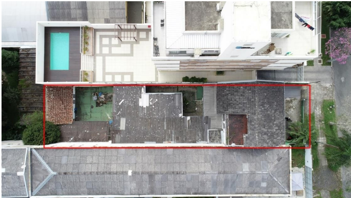
VISTA SUPERIOR DO IMÓVEL