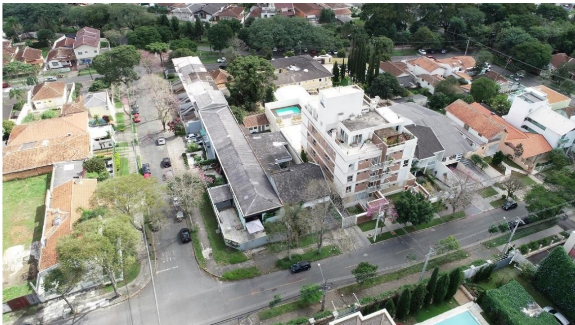
ENTORNO DO IMÓVEL