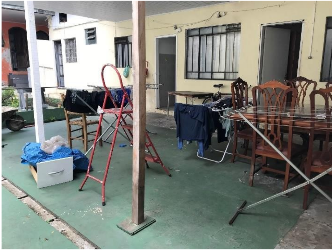
CASAS NO MEIO DO TERRENO