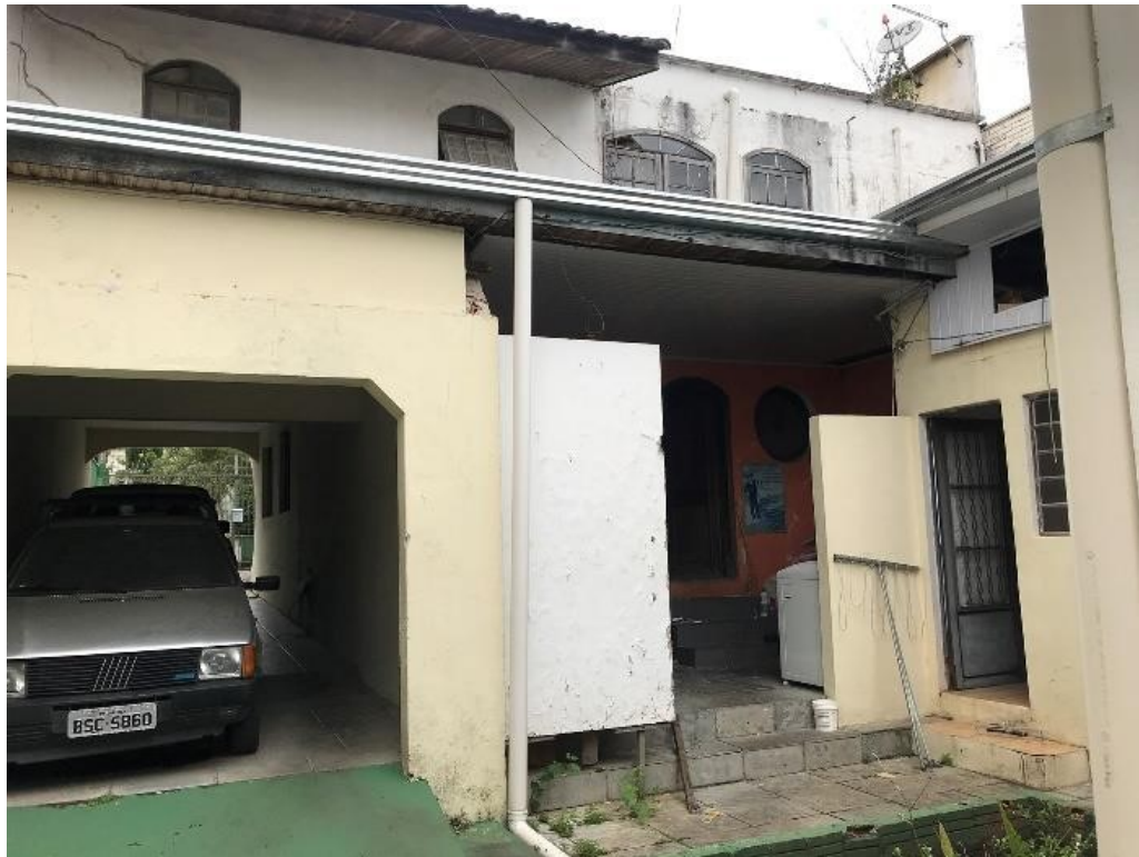
VISTA DA PARTE DE TRÁS DA CASA