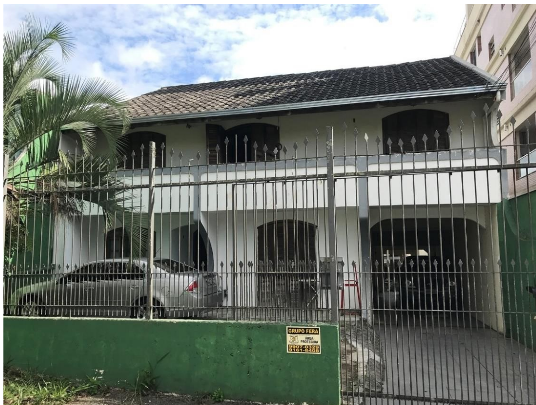
FACHADA DO IMÓVEL

BEM A SER AVALIADO: Imóvel urbano residencial de 432,84 m 2 na Rua Prefeito Ângelo Ferrário Lopes, 1659, Hugo Lange, Curitiba – PR. Terreno com 539m 2 medindo 11m de frente por 49m de extensão da frente aos fundos, contendo: Casa em alvenaria de 233,54m 2 , de médio padrão, 26 anos, com dois pavimentos e garagem coberta para 3 veículos, face leste, com 6 dormitórios, 2 banheiros, sala, cozinha e lavanderia, teto de laje, telhado com telhas de cimento, piso com revestimento cerâmico, esquadrias de madeira. No terreno ainda contém 8 casas térreas em alvenaria de médio padrão, totalizando 199,30m 2 , com telhado de telhas cerâmicas e de fibrocimento, esquadrias de ferro, piso com revestimento cerâmico, totalizando 432,84m 2 . Imóvel em ruim estado de conservação e com pinturas interna e externa ruins.