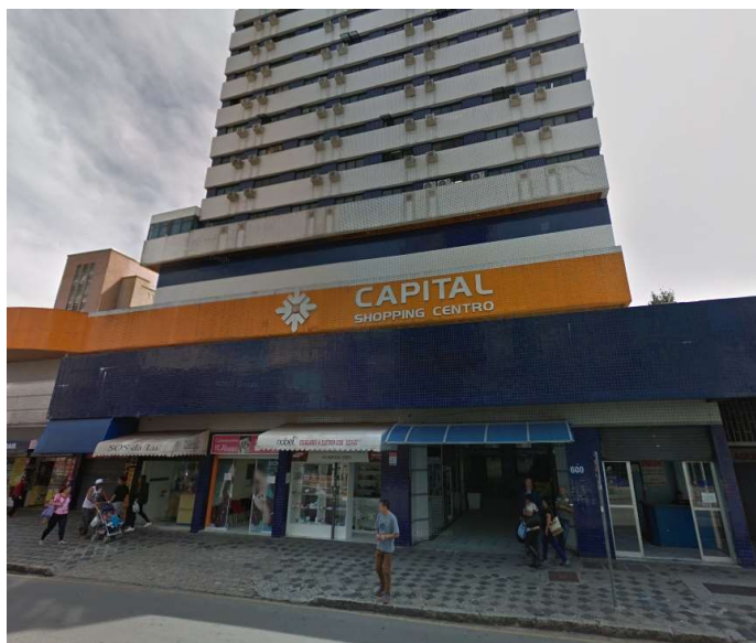
Imagem da fachada do condomínio do imóvel avaliando.