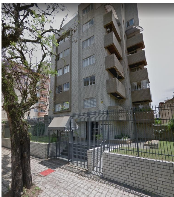
Imagem da fachada do condomínio do imóvel avaliando.