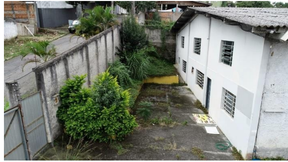
ENTRADA DO IMÓVEL