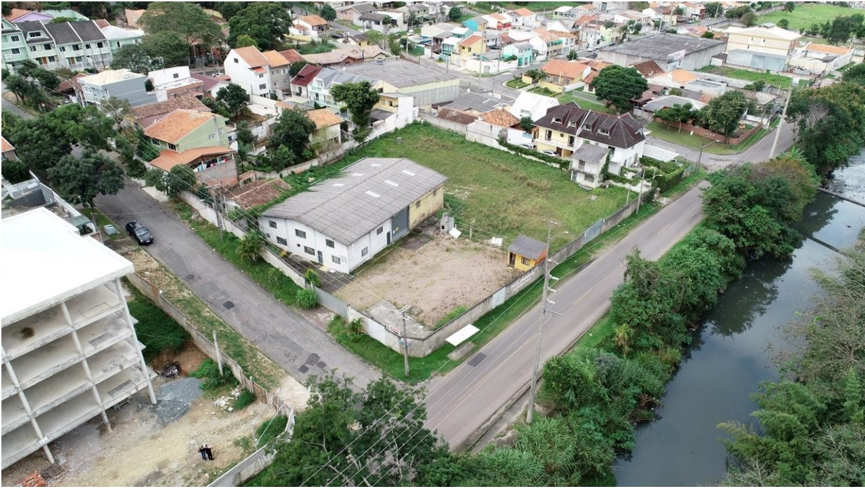
ENTORNO DO IMÓVEL