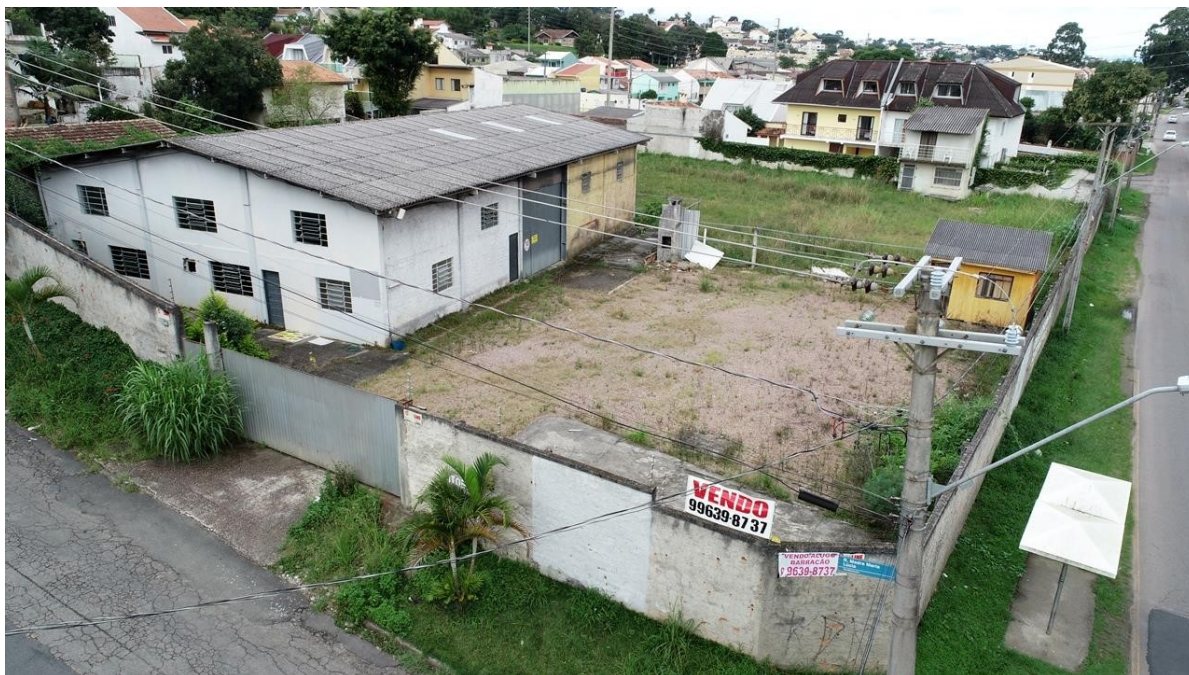
FACHADA DO IMÓVEL