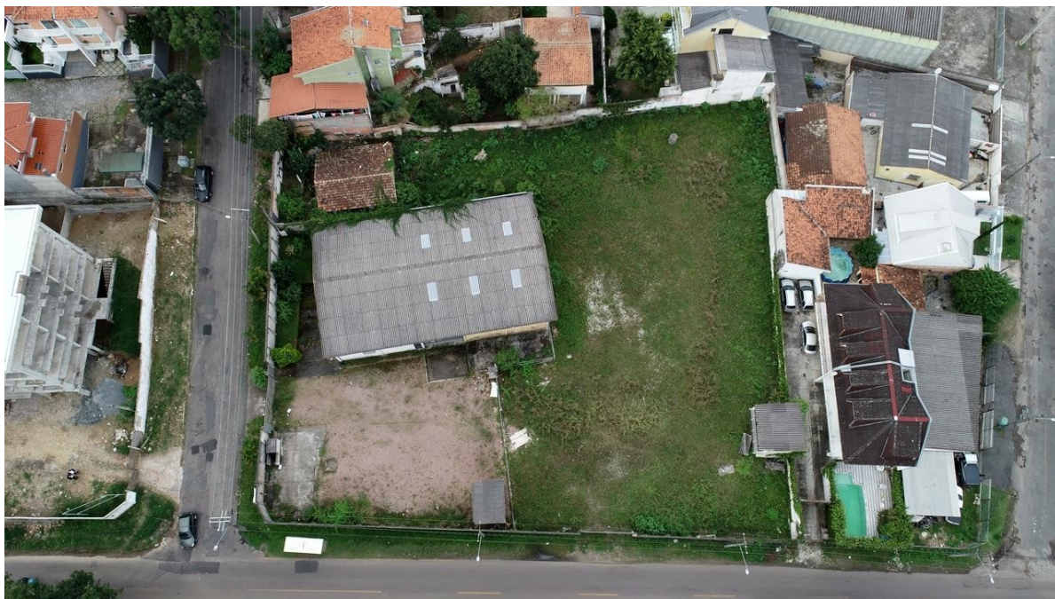
VISTA SUPERIOR DO IMÓVEL