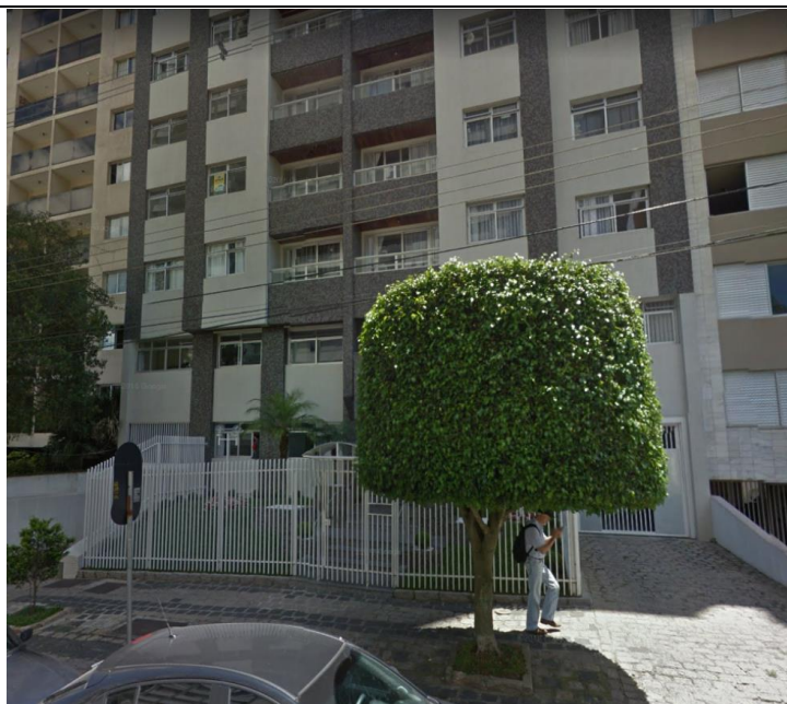
Imagem da fachada imóvel avaliando.